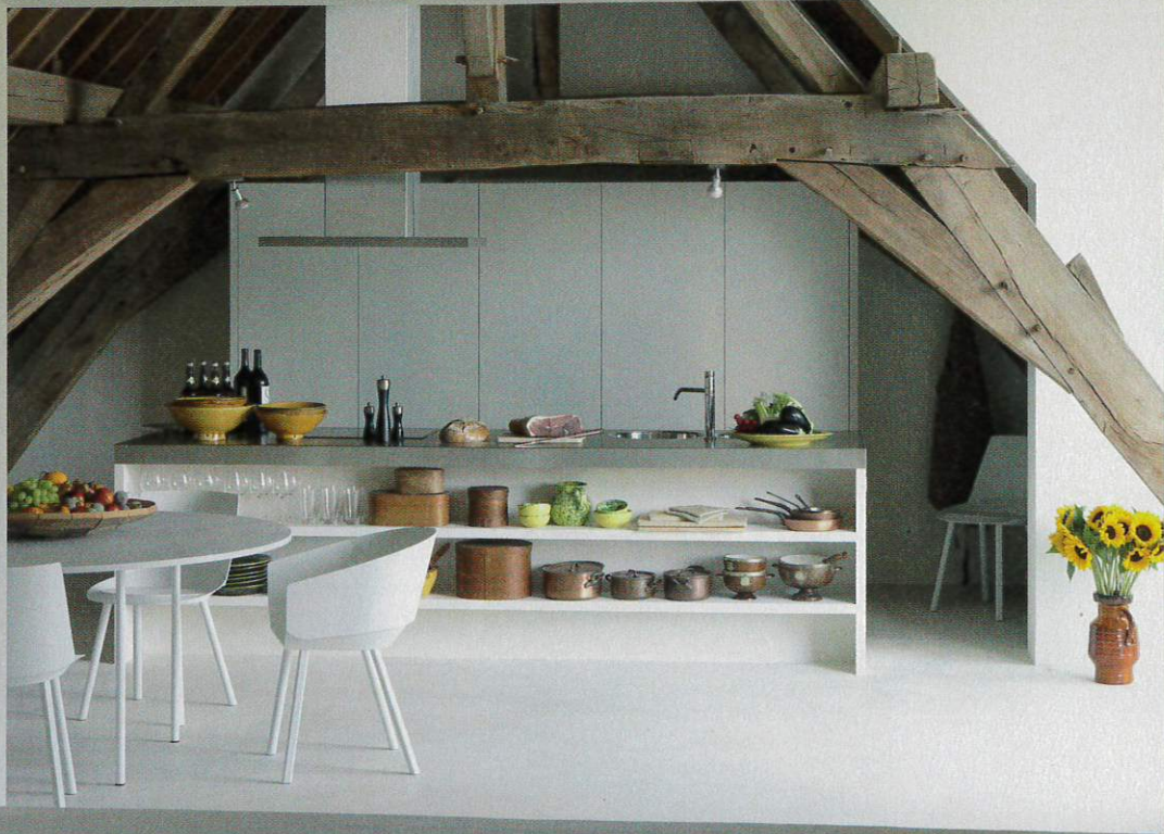
Architect Pieter Vandenhout: „Deze zolder gaven we bewust een hedendaagse toets, om het retro-effect te vermijden.“

O ude panden worden wel eens overgewaardeerd omdat ze een mooie kelder of zolder hebben. Maar als puntje bij paaltje komt, moet je wel bedenken dat je daar niet in gaat wonen. Een oncomfortabel huis met een prachtige kelder wordt nog geen leuke woning. Met zolders ligt dat anders, omdat je er met enkele ingrepen wel iets spannends kunt creëren, al is dat niet eenvoudig. De beste voorbeelden vind je in grote steden, waar zolders als gevolg van plaatsgebrek soms vernuftig worden gerenoveerd tot woonruimte. Deze riante zolder is in ieder geval een inspirerend voorbeeld. Het gaat om een ruimte van liefst 185 vierkante meter, boven het voormalige abdiskwartier van een oud klooster in Diest. „Het gebouw zelf verkeerde vóór de werken in belabberde staat, maar de historische zolder met een prachtig spant, sprak meteen tot de verbeelding. We wisten dat we er iets bijzonders mee konden aanvangen”, legt architect Pieter Vandenhout uit. In Knack Weekend publiceerden we eerder al verschillende historische woningen die door